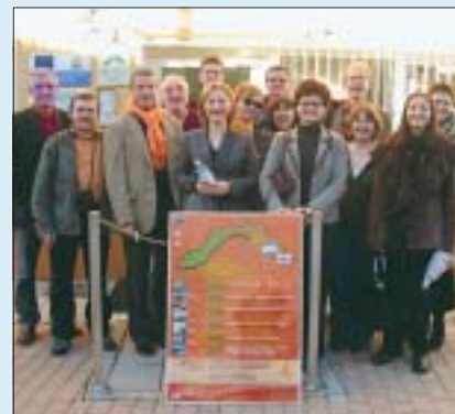
Una delegazione di cooperatori della Polonia, nell'ambito di uno scambio di esperienze con il Progetto Equal "Crescendo", mercoledì 22 novembre sono stati in visita al Consorzio Tassano. L'obiettivo del progetto è quello di sostenere la nascita e lo sviluppo di cooperative sociali, in particolare quelle di tipo B, attraverso la creazione di rapporti stabili con imprese appartenenti al settore no profit.