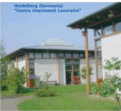
Heidelberg (Germania) "Centro Inserimenti Lavorativi"

nostra attenzione deve esserci il benessere del singolo, della persona; il lavoro è in funzione all'uomo, non viceversa!