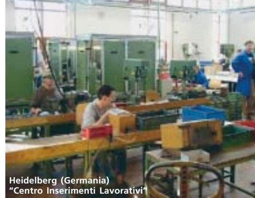
Heidelberg (Germania) "Centro Inserimenti Lavorativi"

► Molte delle persone che cerchiamo di "inserire" vengono da lunghi percorsi dolorosi (problemi fisici, psichici, comportamentali, ecc.) e ai nostri responsabili di settore viene chiesta ...tanta pazienza e tanta comprensione: • c'è chi chiede sovente di essere spostato da una mansione ad un'altra, magari solo perché soggetto a depressione cronica • che in quella mansione, lo destabilizza... • ci si deve rivolgere a ciascuno con particolare attenzione per evitare (e a volte capita) che più di qualcuno si adombri e non ti ascolti più, e devi trovare il modo di sostenerlo... • c'è chi ancora chiede di essere confortato, di essere capito... • poi magari ti capita chi, se non gli lasci fare quello che vuole cerca di intimidirti, di minacciarti: "vado dai sindacati!", "mi metto in mutua!"... • capita anche qualche volta, quando uno ha una crisi piuttosto grave, di dovergli stare vicino per diverso tempo per tranquillizzarlo, mentre si aspetta ...il 118! • un'altro che soffre di manie di persecuzione o paranoie vede nemici dappertutto... • ancora altri devi proteggerli, perché più deboli, più indifesi... • ci sono poi da affrontare le "ricadute": alcool ,